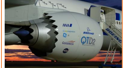
Figura C. Forma asimétrica final—en su lugar en el revestimiento del motor y la boquilla.