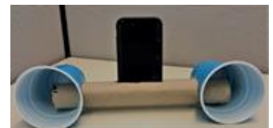
Figura A. Sistema de bocinas construídas para un teléfono.

This material is translated by NASA Partner, NASA STEM EPDC under award number 80NSSC19M0184. For more information contact nasastemepdc@txstate.edu